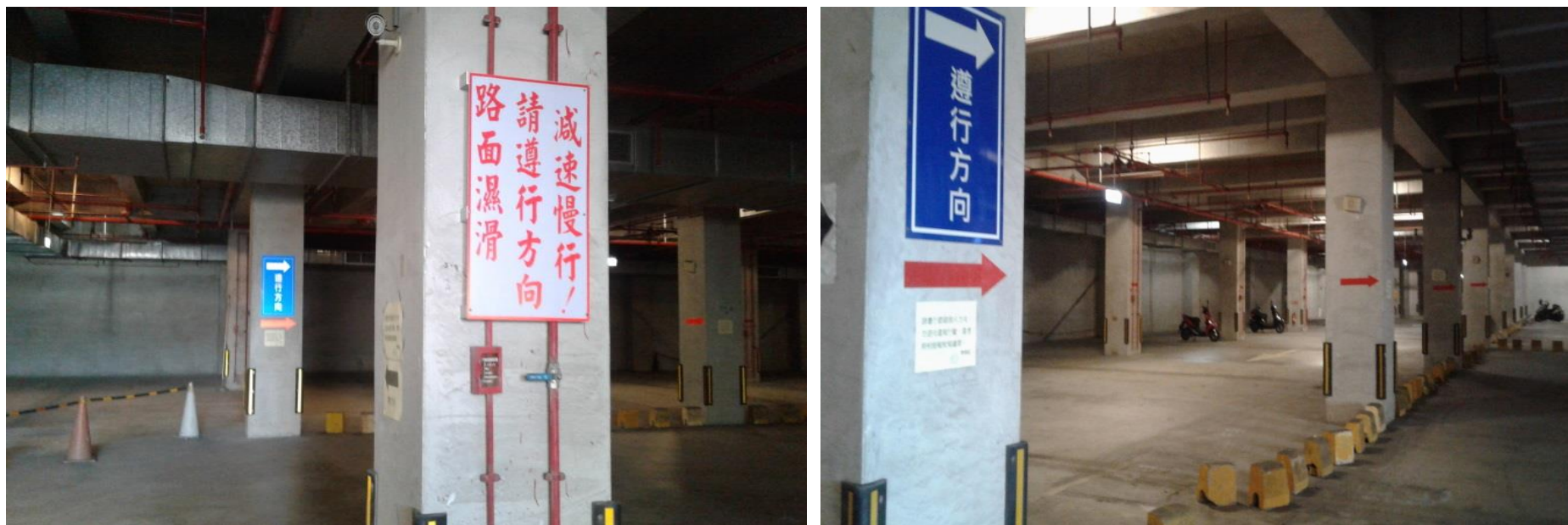
※學生地下室停車場行車方向圖