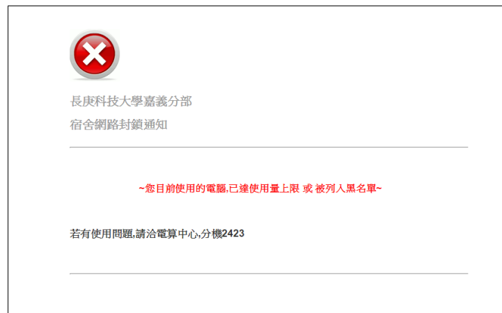
流量超過被鎖畫面