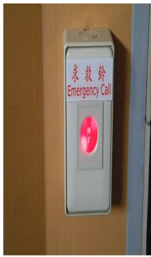
每間廁所及寢室緊急警報